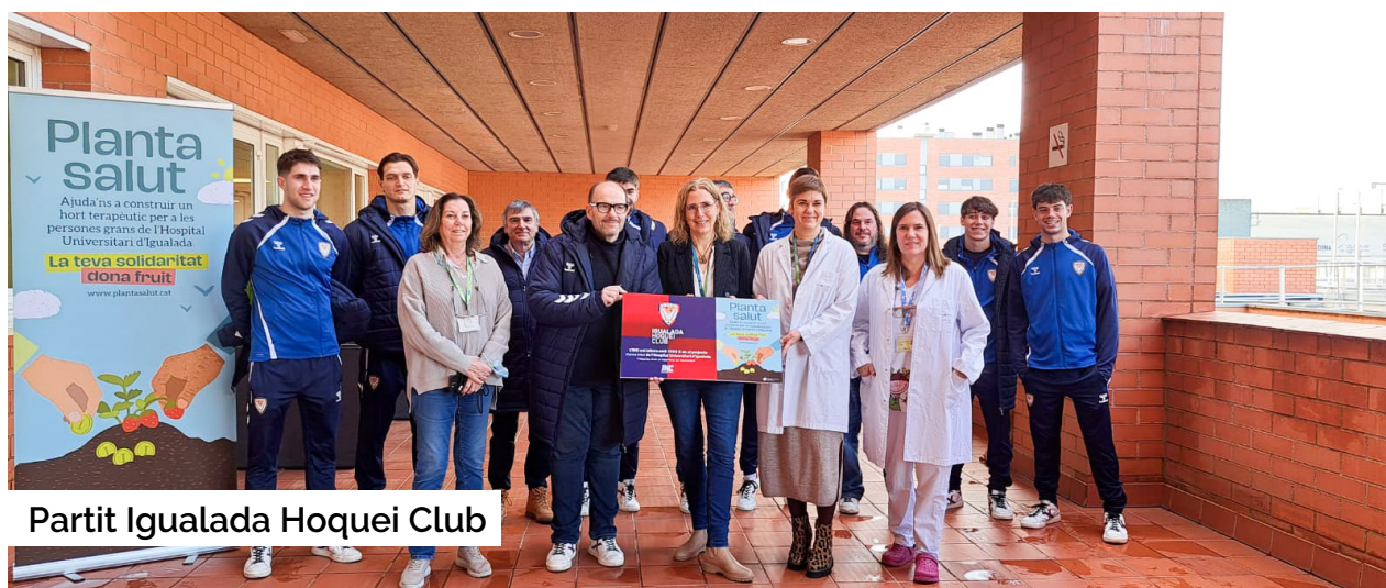
Partit Igualada Hoquei Club