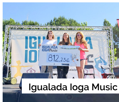
Igualada Ioga Music