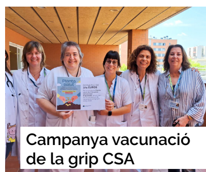
Campanya vacunació de la grip CSA