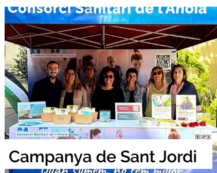
Campanya de Sant Jordi Quan sumem, no fem millor