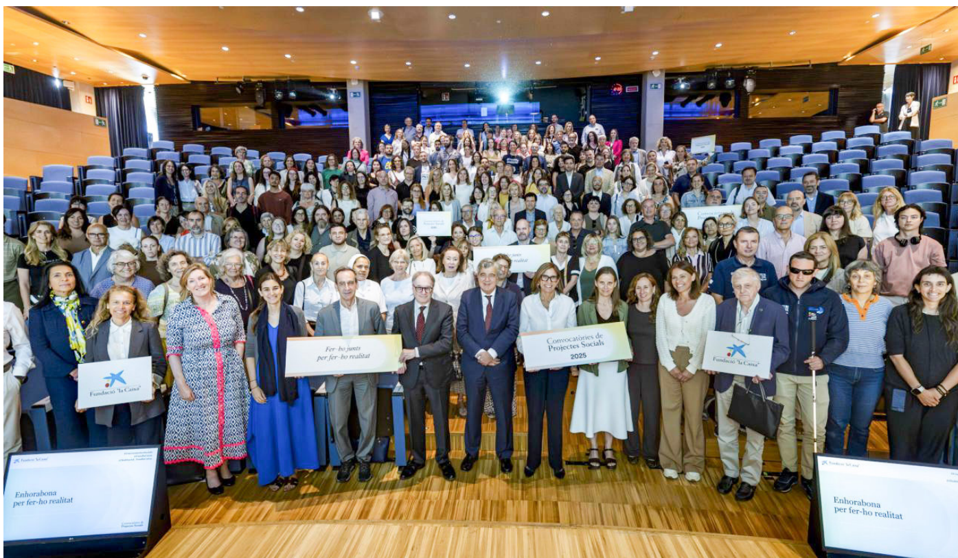
Acte de presentació de la resolució de la Convocatòria de Projectes Socials 2025 de la Fundació "la Caixa" (Barcelona, 3 de juny de 2026)

A la Convocatòria de Projectes Socials Catalunya 2025 s'hi han presentat 916 iniciatives d'entitats molt diverses, dels quals se n'han seleccionat 331, on es destinaran més de 10,5 milions d'euros. Segons explica la Fundació, enguany s'ha aconseguit un impacte molt elevat al territori, amb projectes distribuïts entre 73 municipis catalans, entre els quals Igualada.