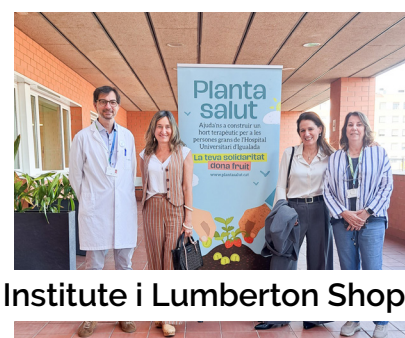
Iniciatives de New York Institute i Lumberton Shop